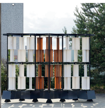
Éoliennes - Philéole