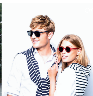
Lunettes - Armor lux