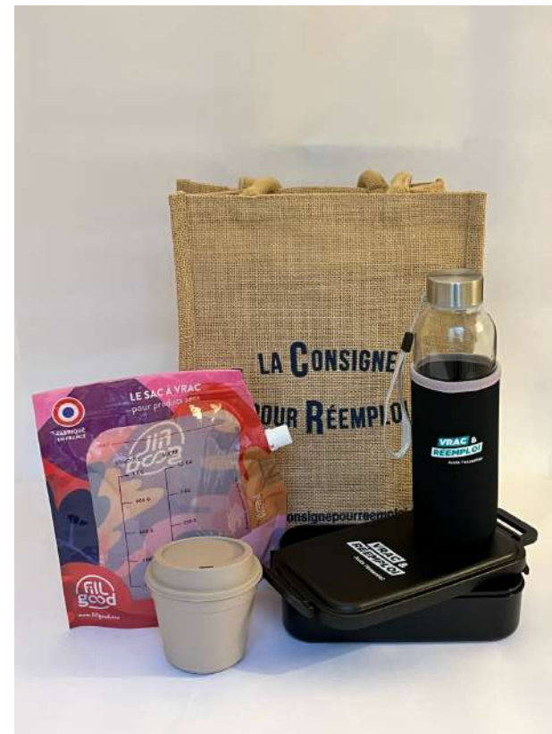
Exemples de l'édition 2024